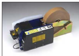
C-300 (300 mm Rollendurchmesser)