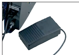
P 25 Fußschalter