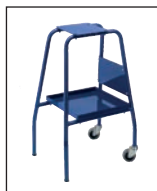
C 9 Gerätetisch