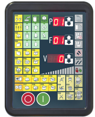
HS (Horse Shoe)